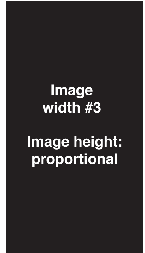
Fig. 4: Ero optibus dolorecto ium ressinum