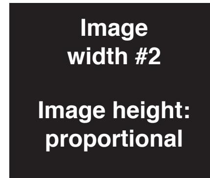
Fig. 3: Ero optibus dolorecto ium ressinum